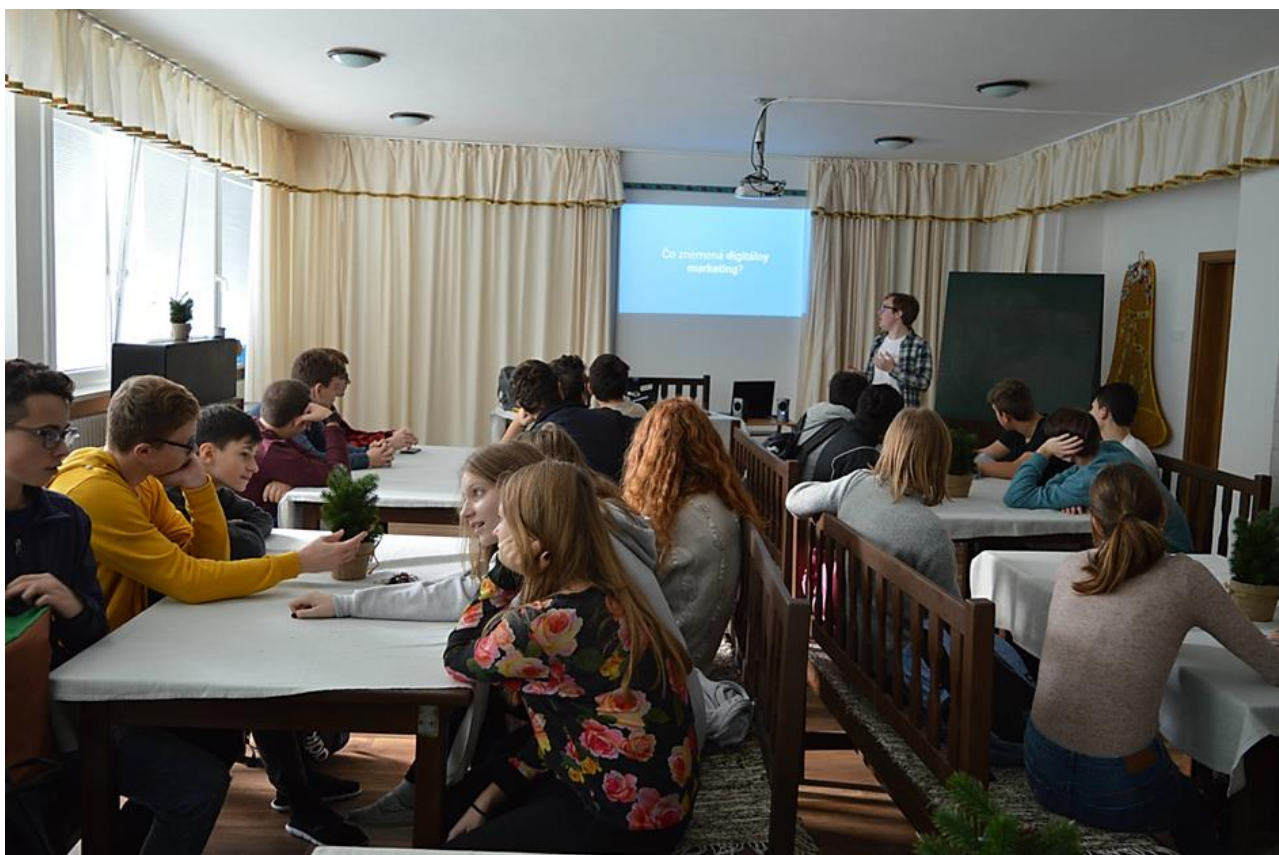
Text a foto K.Csúz