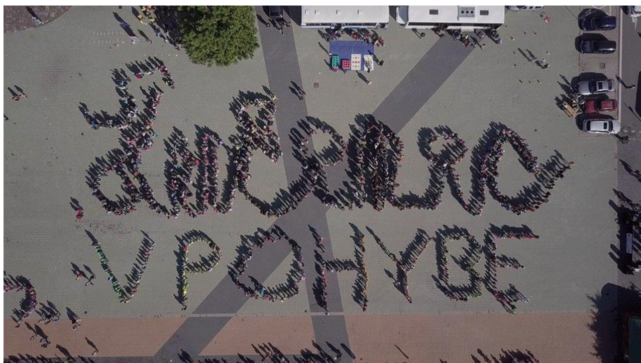
Vyvreholením dňa bol živý obraz—my sme boli písmeno U