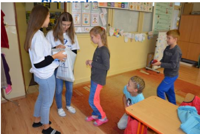
Ochotných prispieť bolo veľa

Únia nevidiacich a slabozrakých Slovenska