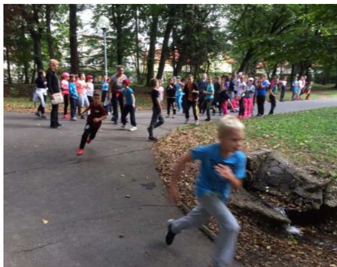
Ale stanovišť bolo oveľa viac, napríklad v parku