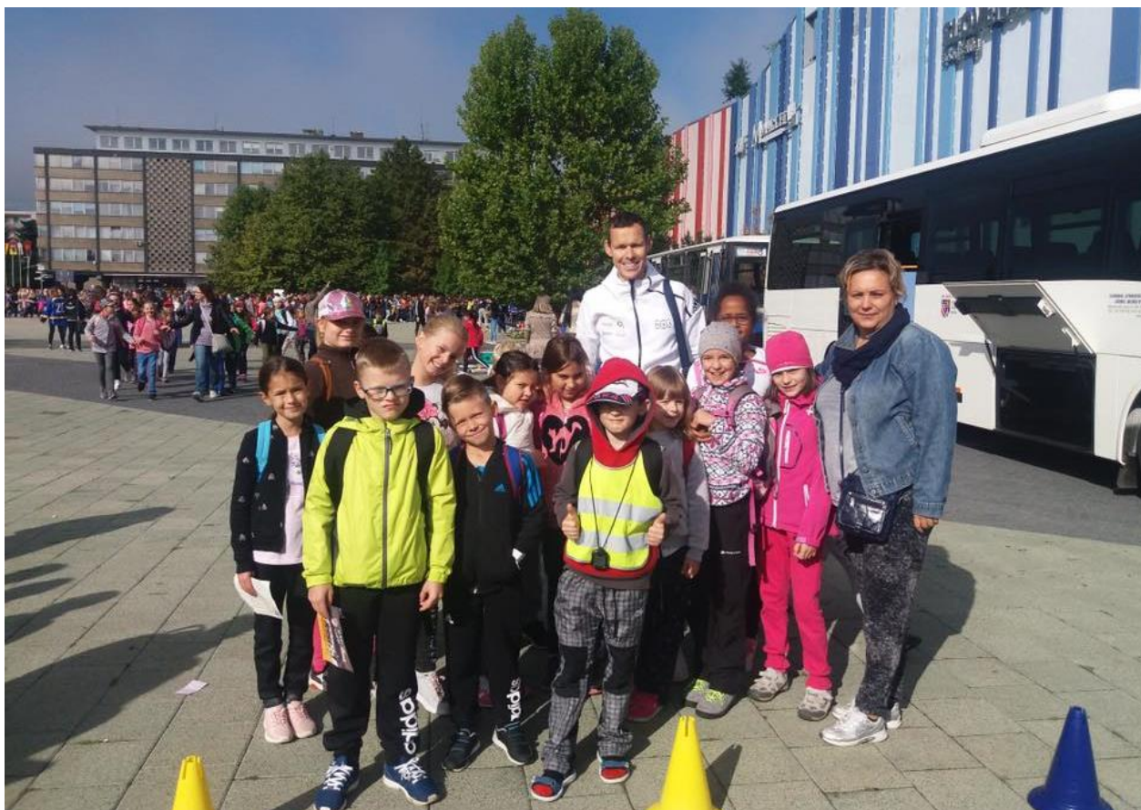
A trochu sa aj pózovalo, ale v tomto prípade nezabudnuteľná snímka s olympionikom Matejom Tóthom